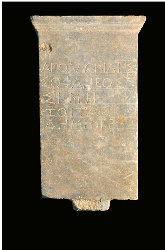
Εικ. 5. Ἡ ἀναθηματικὴ ἐπιγραφή.