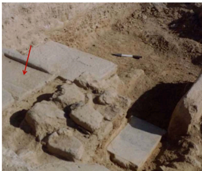
Εἰκ. 2. Οἰκόπ. Βοξάκη – Βορριά. Τὸ βάθρο ὅπου θὰ ἦταν στημένο τὸ ἄγαλμα ἐντὸς τοῦ οἴκου λατρείας (βλ. τὸ βέλος) καὶ πεσμένη ἢ ἀναθηματικὴ ἐπιγραφή (κάτω δεξιά).

Τὸ ἱερὸ τῆς Δήμητρος στὴν πόλη τῆς Χίου. Νέα ἀρχαιολογικὰ καὶ ἐπιγραφικὰ τεκμήρια