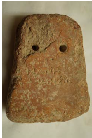
Εικ. 4. Ἡ ἀγνύθα τῆς Νάνης AMX 14142 α.