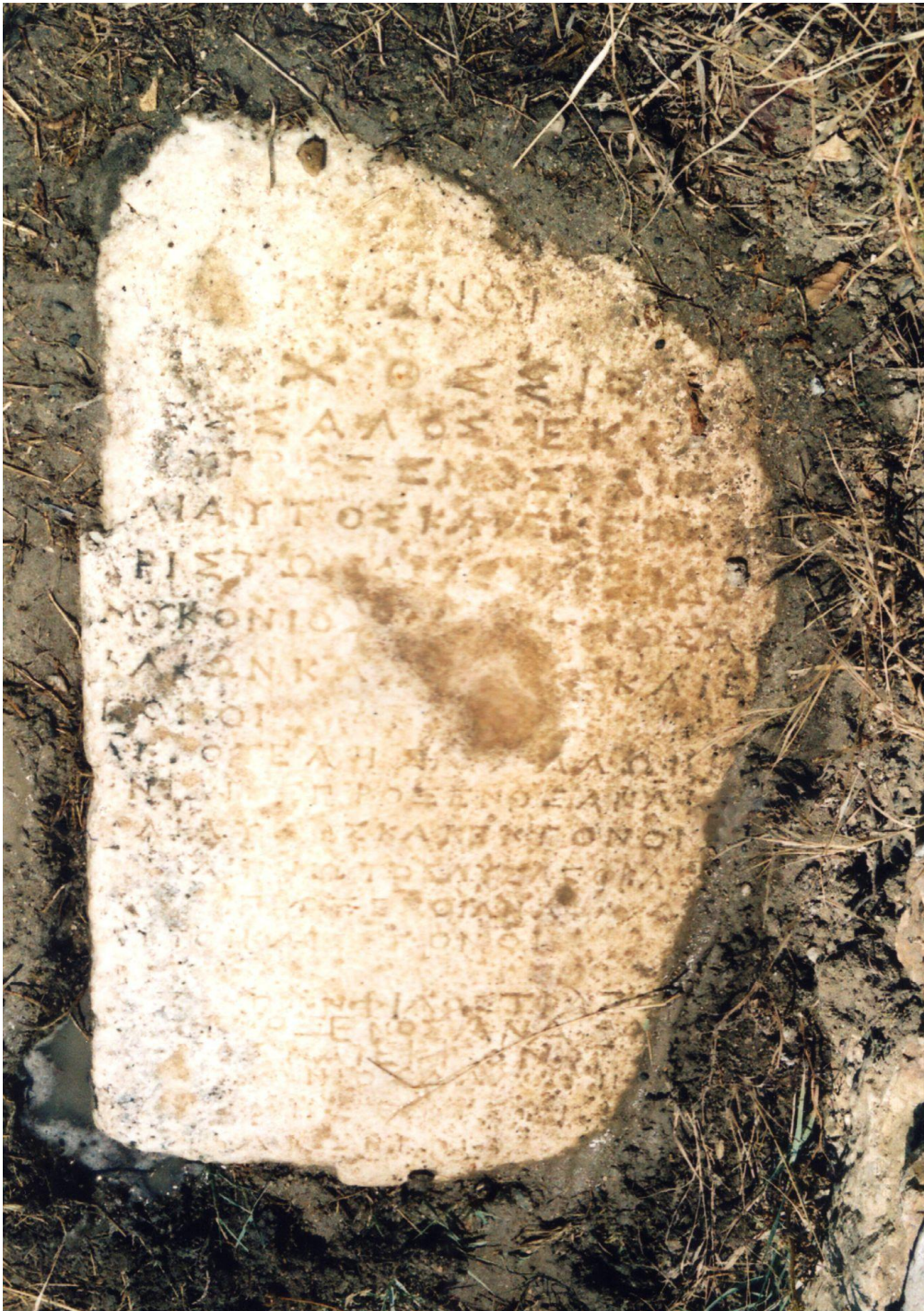
Εικ. 5. Ἡ ἐπιγραφή