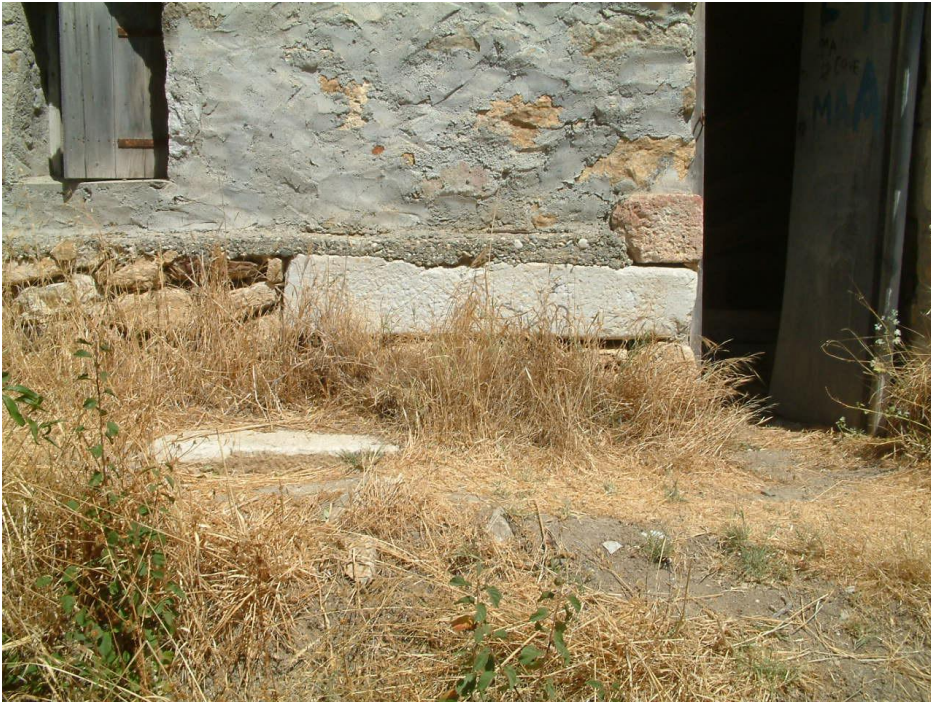
Εικ. 3. Η θέση της επιγραφής παρά την είσοδο του ληνοῦ