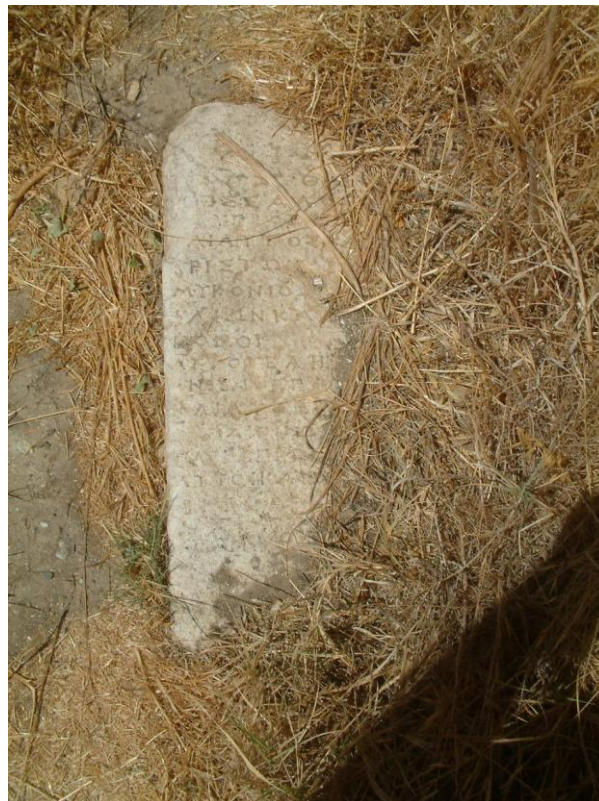
Εικ. 4. Η επιγραφή, ὅπως διακρινόταν χωμένη στην γῆ