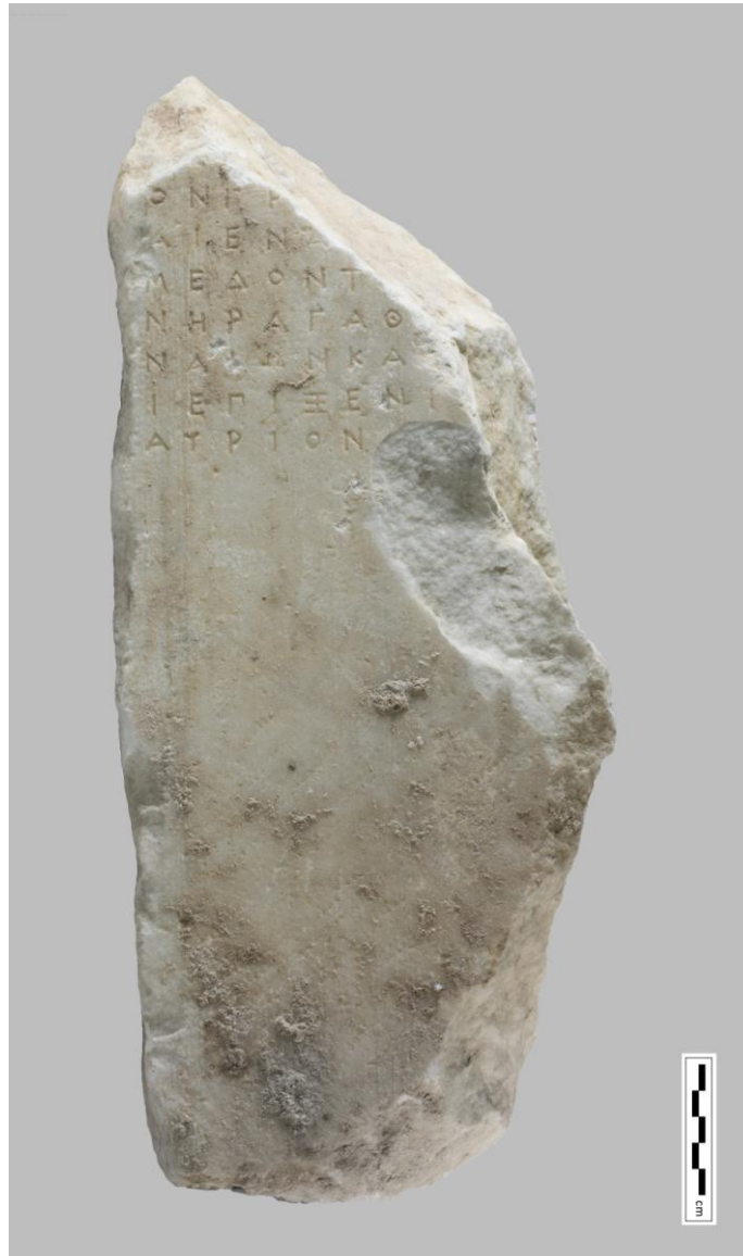
Εἰκ. 1. Τὸ θραῦσμα τοῦ ψηφίσματος.

συμπληρωθεῖ τὸ κατὰ γενικὴ πληθυντικῶ ὄνομα τοῦ ἄλλου δήμου, με τὸν ὅποιο προφανῶς σχετιζόταν εὐθέως καὶ ὁ ἐπαινούμενος Μέδων.