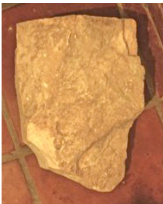
Εικ. 3. Ή πίσω όψη του κιονίσκου