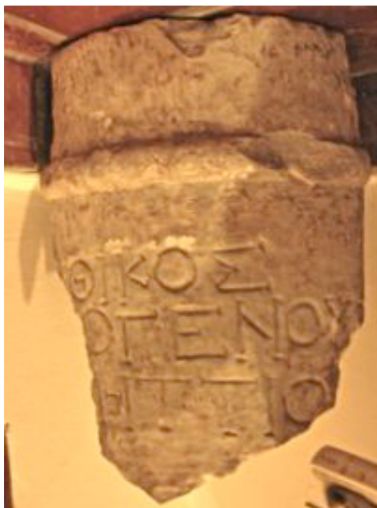
Εικ. 2. Ό κιονίσκος από διαφορετική γωνία