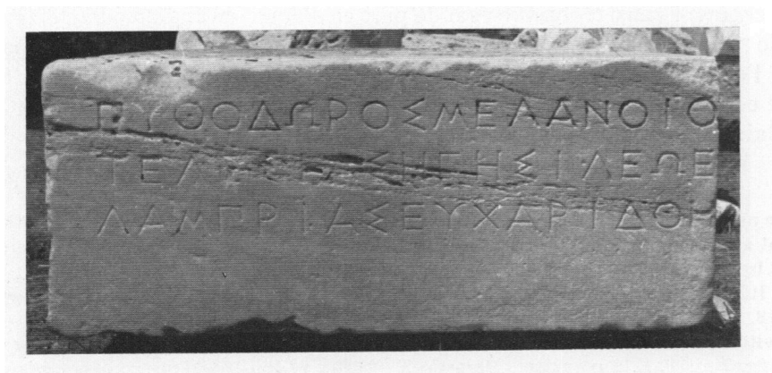
Εἰκ. 2. Ἡ ἐπιγραφή. ( BCH 100, 1976, 45, εἰκ. 24).