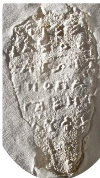
Εικ. 2. Ἐκτυπο τῆς ἐπιγραφῆς (Α.Π.Μ.).