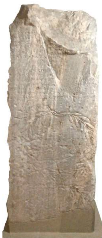
Εικ. 3. Ἡ βάση IG II 2 1155 b.