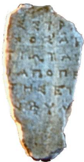
Εικ. 1. Τὸ θραύσμα MA 16802.