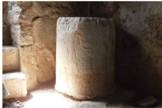
Εἰκ. 2. Τὸ βᾶθρο στὸ ἐσωτερικὸ τῆς ἐκκλησίας.