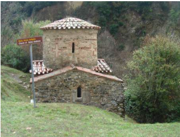
Εἰκ. 1. Ὁ Ἅγιος Ἀνδρέας.

Ἔνα ἢ περισσότερα μέλη οἰκογενείας ἀναθέτουν ἄγαλμα τοῦ πατέρα, τῆς μητέρας ἢ τῆς θυγατέρας τους στὸν Ἀσκληπιὸ καὶ τὴν Ὑγία.