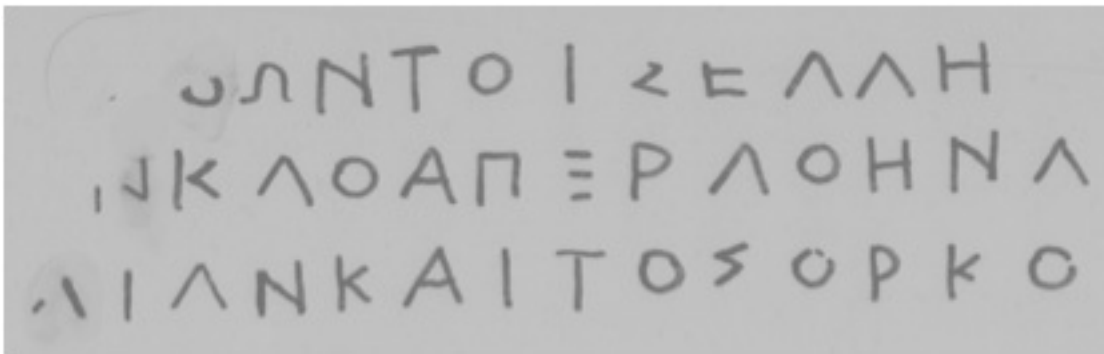
Εἰκ. 2. IG II 2 35 , fr. a.1-3 (σχεδιογράφημα Α.Π.Μ.)