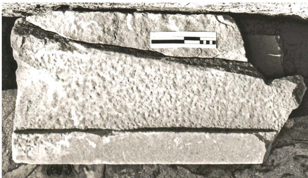
Εικ. 4. Ἡ ἄνω πλευρὰ τῆς ἐπιγραφῆς ὑπ' ἀρ. 2.