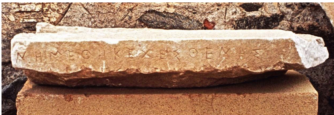
Εικ. 3. Ἡ ἐπιτύμβια ἐπιγραφή ὑπ' ἀρ. 2.