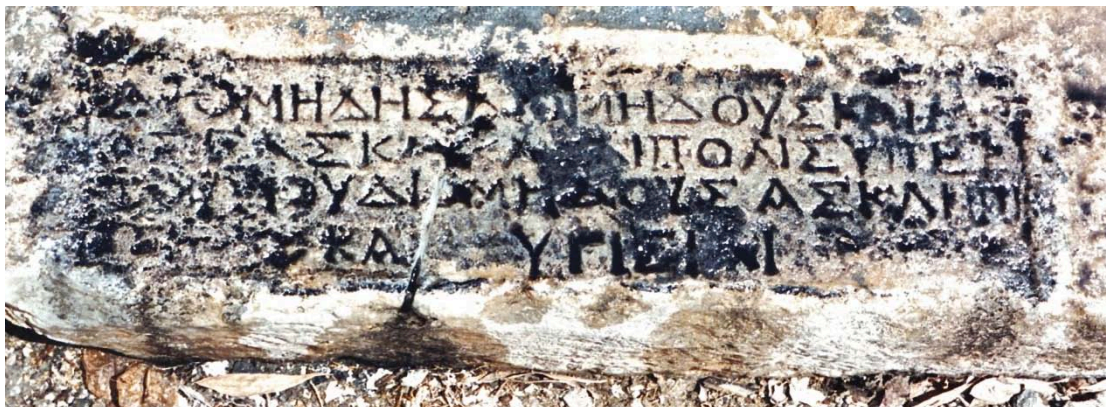
Εικ. 8. Ανάθεση στὸν Ἀσκληπιὸν καὶ τὴν Ὑγίειαν· ἡ ἐπιγραφή.