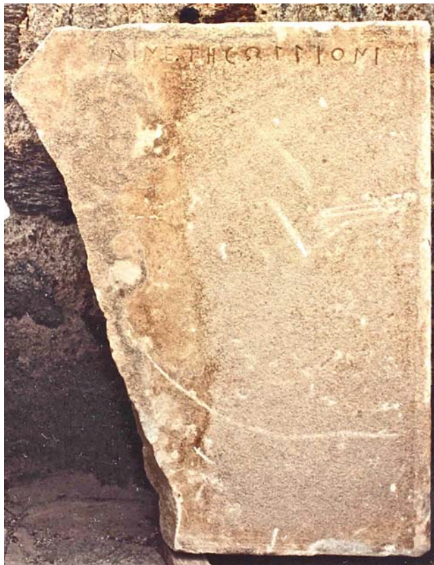
Εικ. 1. Τὸ ἐπιτύμβιο μνημεῖο τοῦ Βο(υ)λλίωνος.