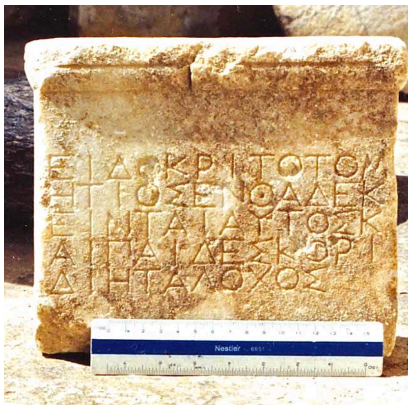
Εικ. 5. Ἡ ἐπιτύμβια στήλη τοῦ Εἰδοκρίτου καὶ τῆς οἰκογενείας του.