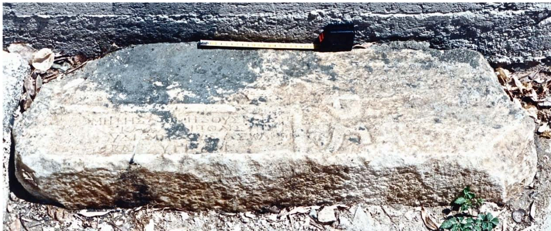
Εικ. 7. Ανάθεση στὸν Ἀσκληπιὸν καὶ τὴν Ὑγίειαν.