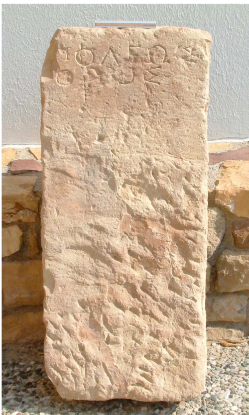
Εἰκ. 1. Ὁ νέος Χιακὸς ὄρος πόλεως

Ἡ θέση εὐρέσεως τοῦ νέου Χιακοῦ ὄρου μακριὰ ἀπὸ τὸ λιμάνι καὶ παρὰ τὸ ἄκρον τῆς πόλεως πλησίον τόπων, ὅπου βρέθηκαν ταφές, ἐνισχύει τὴν ἄποψη περὶ τῆς χρήσεως τῶν ὄρων αὐτῶν ὡς ὀρίων δημοσίας γῆς.