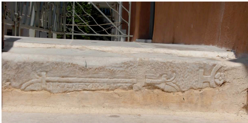
Εικ. 7. Ἡ ἐπιγραφή τοῦ Νίκωνος (οἰκία Δημητρακοπούλου)