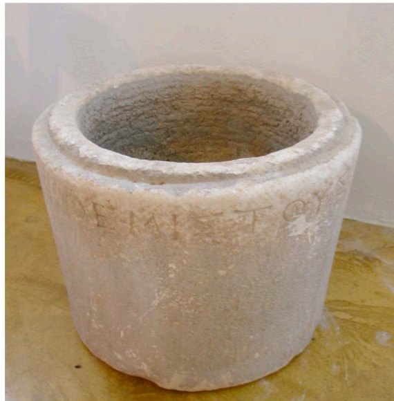
Εἰκ. 5. Ἡ τεφροδόχος κάλπις τῆς Θεμιστοῦς (κατοχή Μ. Μαύρη)