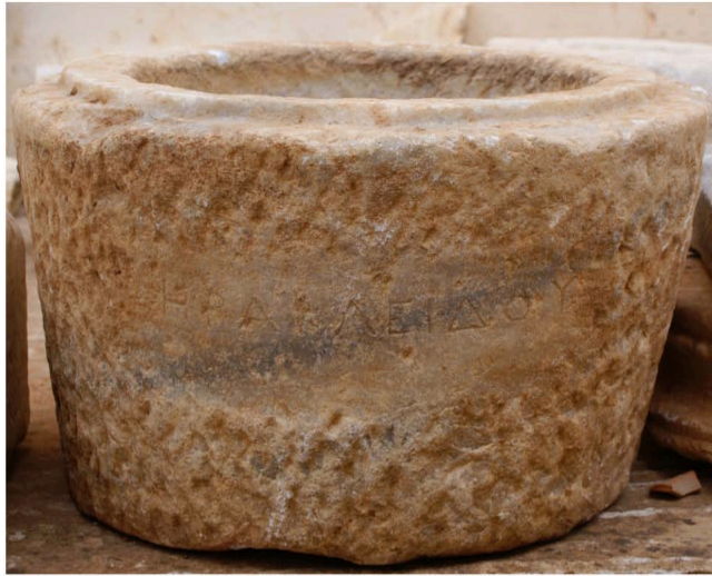
Εἰκ. 4. Ἡ τεφροδόχος κάλπις τοῦ Ἡρακλείδου (ΜΠ Α1797)