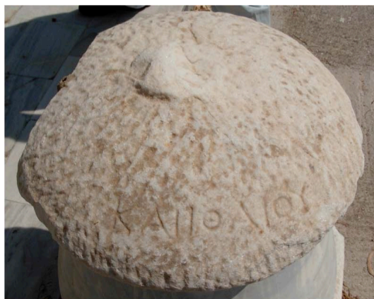
Εἰκ. 6. Τὸ πῶμα τῆς τεφροδόχου κάλπιδος τοῦ Ἰθαίου (κατοχή Ἐμμ. Δαφερέρα)