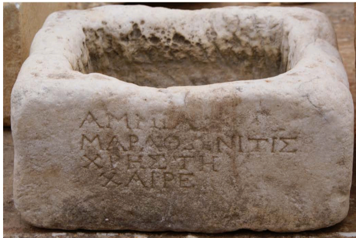
Εικ. 1. Ἡ βάση τῆς Ἀμμίας (ΜΠ Α1769)