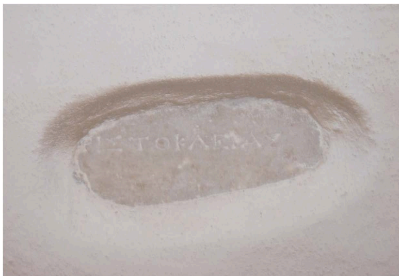
Εικ. 8. Ἡ ἐπιγραφή τῆς Ἀριστοκλείας (οἰκία Δαμία)