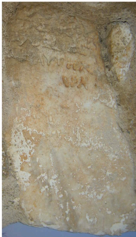
Εἰκ. 4. Ἡ ἐπιγραφή