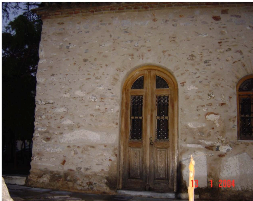
Εικ. 2. Οί Άγιοι Σαράντα στην νέα τους θέση