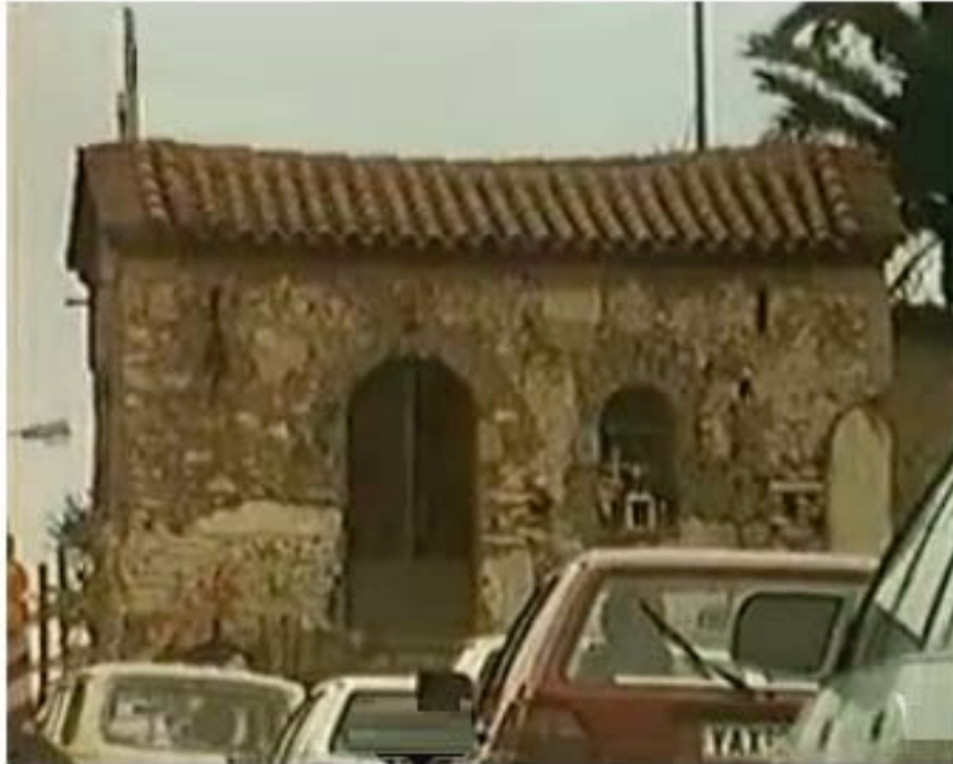
Εικ. 1. Οί Άγιοι Σαράντα στην αρχική τους θέση.