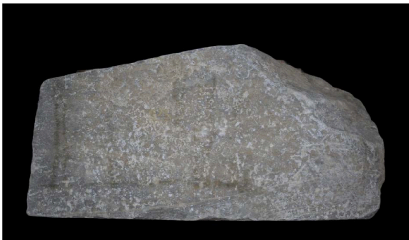
Εικ. 1. Η άνω επιφάνεια της βάσεως.