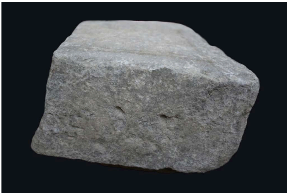
Εικ. 3. Η αριστερή πλευρά της βάσης.