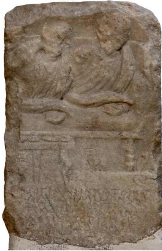
Εικ. 1. Η ενεπίγραφη ανάγλυφη στήλη από την Αμοργό ΕΑΜ 6205.