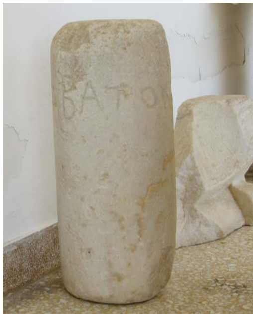
Εἰκ. 2. Ἡ ἐπιγραφή τοῦ ἀβάτου IG XII 5, 255.