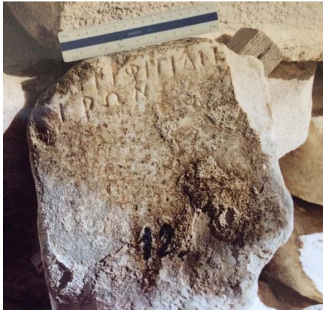
Εἰκ. 1. Ὁ ὄρος τοῦ ἱεροῦ τῶν Ἀντιφιλιδιέων.