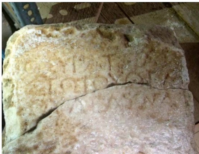
Εικ. 5. Ὁ ὄρος τοῦ Διὸς Ὑπάτου (λεπτομέρεια).