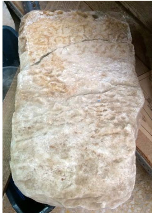
Εικ. 4. Ὁ ὄρος τοῦ Διὸς Ὑπάτου.