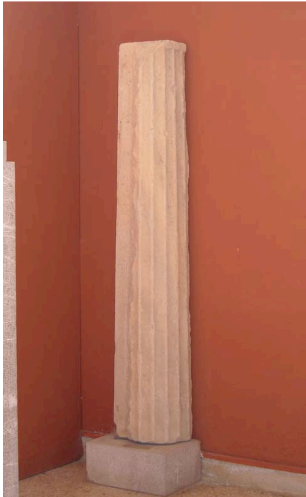
Εικ. 6. Ὁ κίον ἀναθήματος τοῦ Πολυαρήτου.