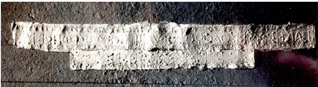
Εικ. 7. Φωτ. ἐκτύπου τῆς ἐπιγραφῆς τοῦ κίονος.