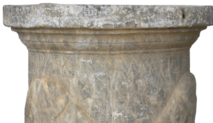
Εικ. 6.2. Ό βωμός της Φάυστας (λεπτομέρεια)