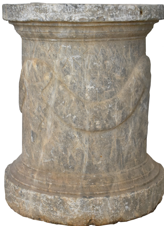
Εικ. 6.1. Ό βωμός της Φάυστας