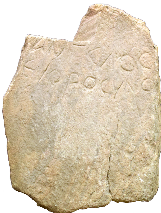
Εἰκ. 5.1. Ὁ ἐπιτύμβιος λίθος τοῦ Εὐφροσύνου