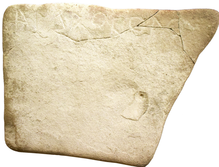
Εικ. 4.1. Ο πλακοειδής λίθος του Άνδροβόλου