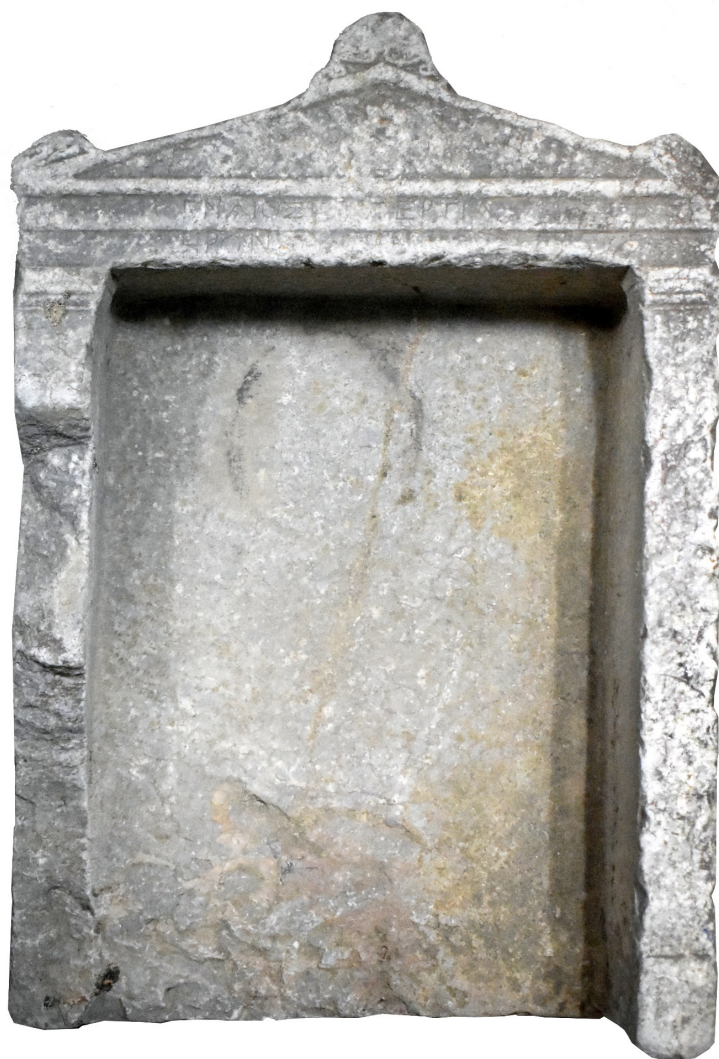
Εἰκ. 7. Ὁ ἐπιτύμβιος ναῖσκος IG XII 3, 434 (Suppl., p. 300)

Ἐπιτύμβιες ἐπιγραφές ἐκ Θήρας καὶ ἐπανεύρεση τῆς ἐπιγραφῆς IG XII 3, 434