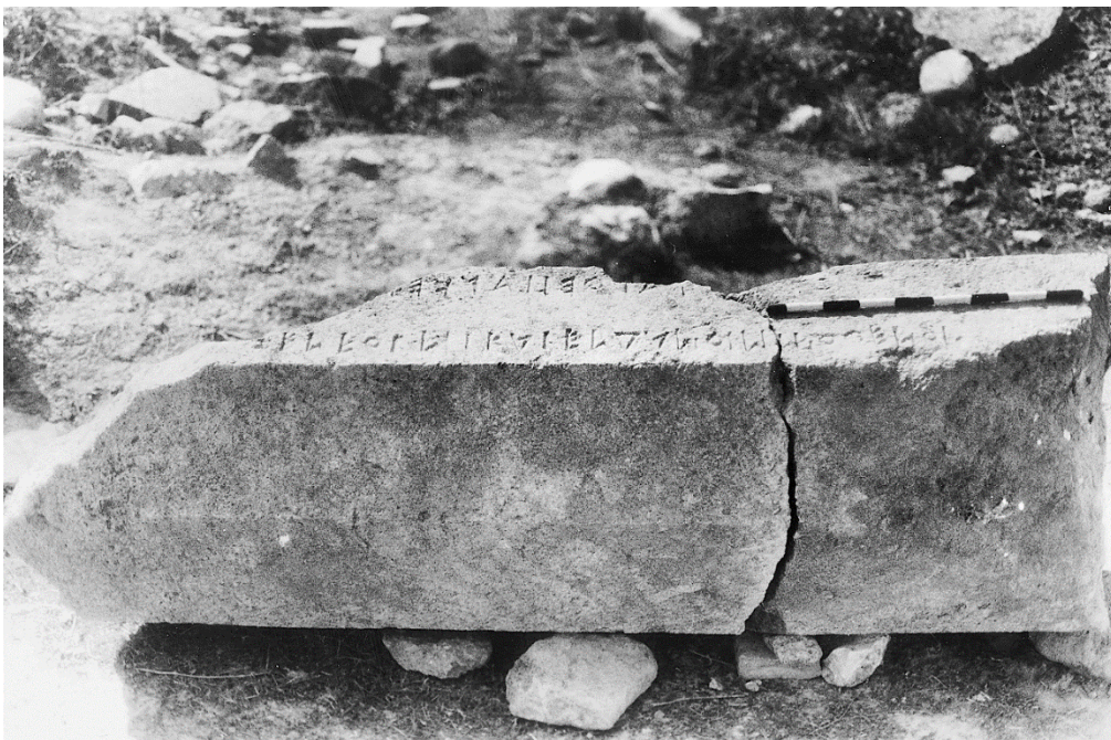
Εἰκ. 1, 2. Ὁ ἐνεπίγραφος κίων στὸν χῶρο τῆς ἀνασκαφῆς