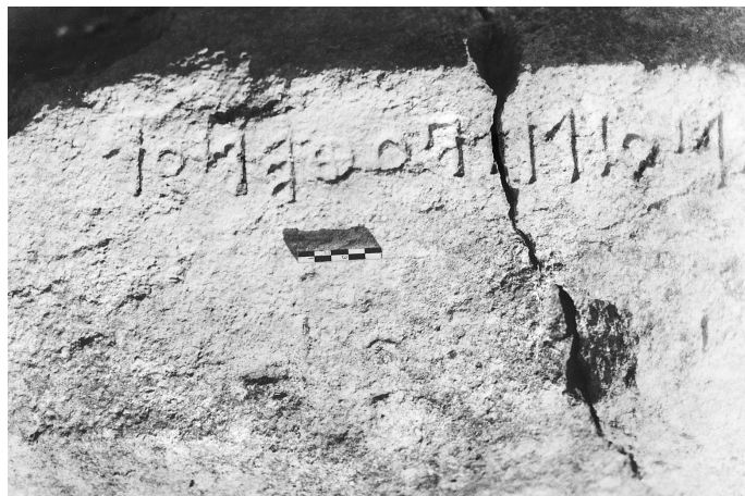
Εικ. 3, 4. Τμήματα της έπιγραφής