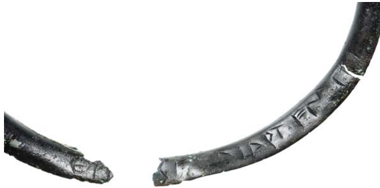
Εικ. 3. Τα ίδια θραύσματα με διαφορετικό φωτισμό.