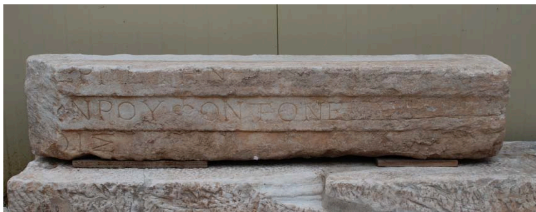
Εικ. 1. ΠΛ 2022

αποφανθώ αν το νέο επιστύλιο ανήκε σε ναό, ναϊσκόσχημο κτίσμα, ή στοά. Λόγω μεγέθους δεν θα μεταφέρθηκε στο σημείο εύρεσης από πολύ μακριά.