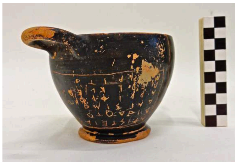
Εικ. 1. Ὁ ἐνεπίγραφος σκύφος (ΗΟΡΟΣ 22-25, 2010-13, 186).