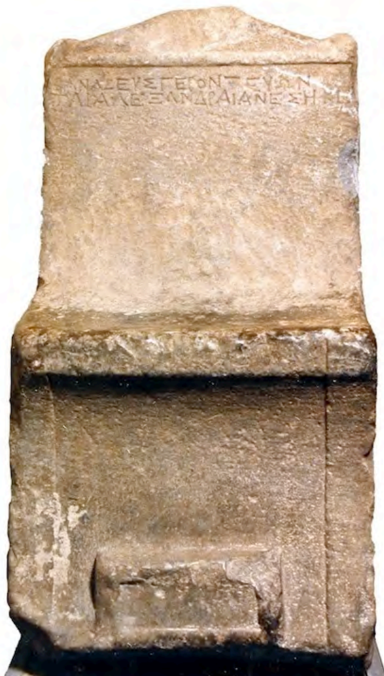
Εικ. 7. Ὁ θρόνος τοῦ Βαναξέως (Μ.Σ. ἀρ. 10994)