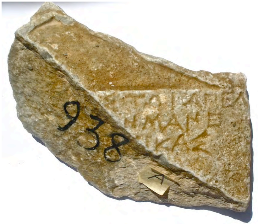
Εικ. 3. Ανάθημα γεροντεύοντος στον Αμυκλαίο Απόλλωνα (Μ.Σ. ἀρ. 938)