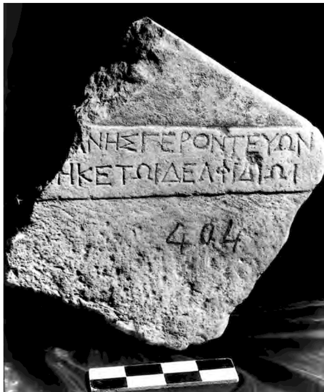
Εἰκ. 6. Ἀνάθημα γεροντεύοντος στὸν Ἀπόλλωνα Δελφίδιο (Μ.Σ. ἀρ. 404)