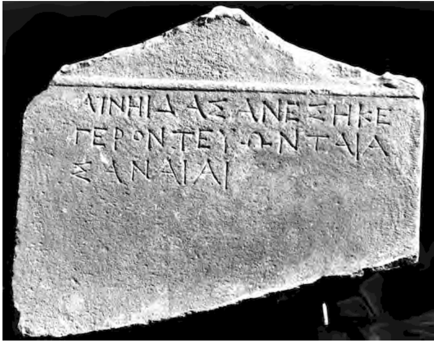
Εἰκ. 5. Ἀνάθημα τοῦ γεροντεύοντος Αἰνησίδα (Μ.Σ. ἀρ. 2775)