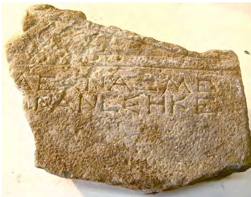
Εἰκ. 2. Τὸ ἀνάθημα τοῦ Λεάνακτος (Μ.Σ. ἀρ. 14500)