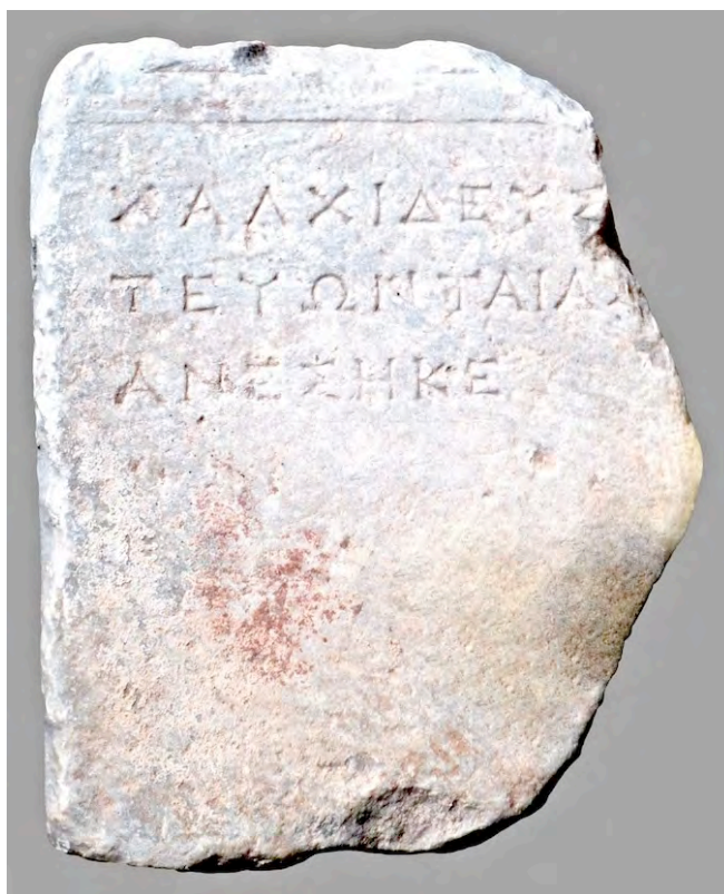
Εἰκ. 1. Τὸ ἀνάθημα τοῦ Χαλκιδέως (Συλλογὴ Μυστρᾶ)