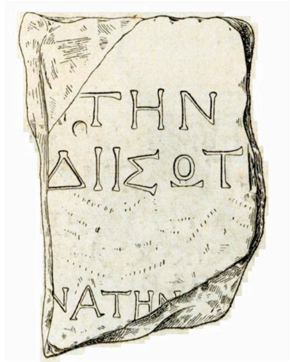
Εικ. 2. Σχέδιο της επιγραφής IosPE I 2 161 ( IosPE I 2 , σ. 177)