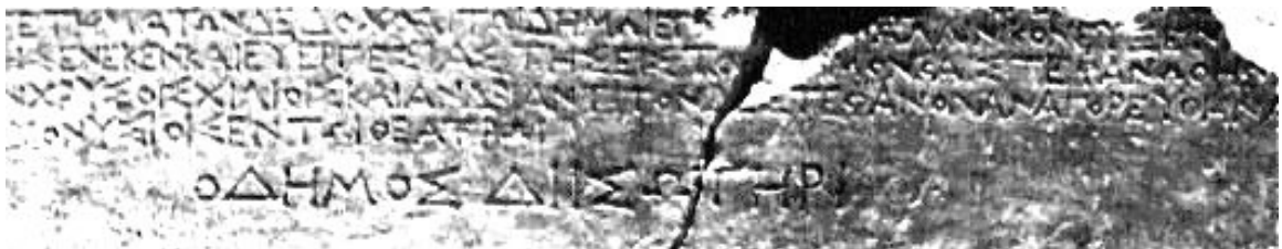
Εικ. 3. Η επιγραφή IosPE I 2 25+31