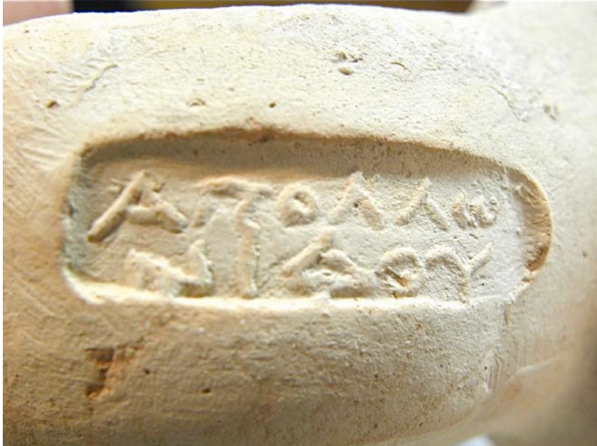
Εικ. 1. Η ενσφράγιστη λαβή υπ' αρ. 1.