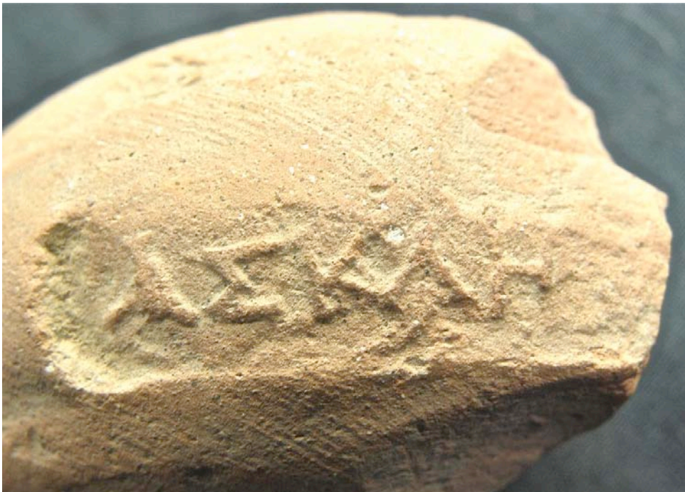
Εικ. 2. Η ενσφράγιστη λαβή υπ' αρ. 2.