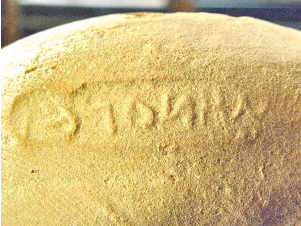
Εικ. 9. Η ενσφράγιστη λαβή υπ' αρ. 7.