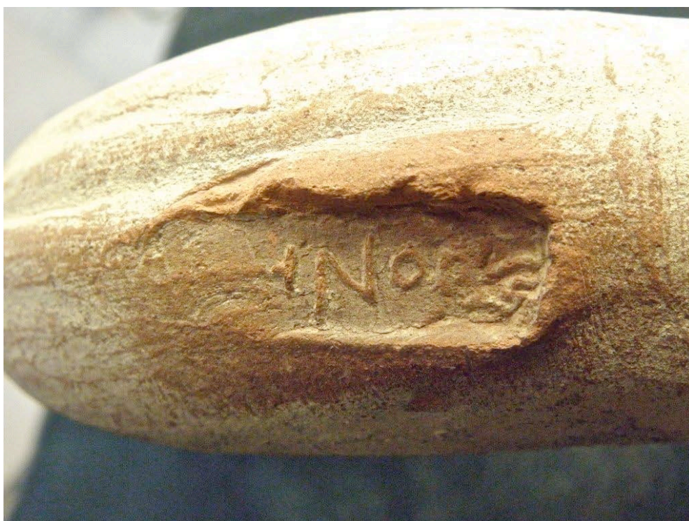
Εικ. 8. Η ενσφράγιστη λαβή υπ' αρ. 6.