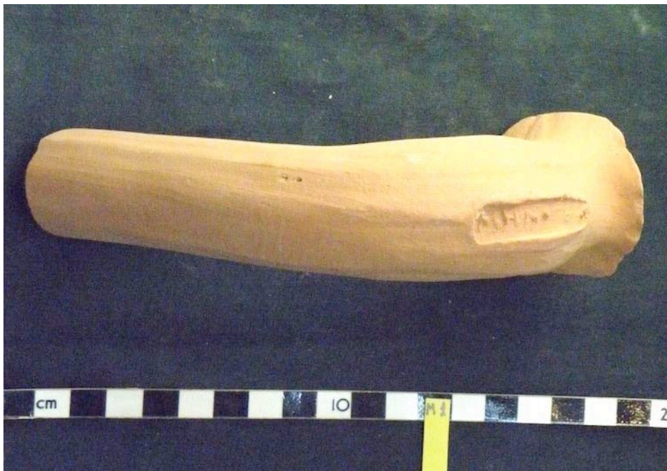
Εικ. 6. Η ενσφράγιστη λαβή υπ' αρ. 5.