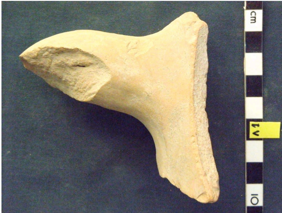
Εικ. 5. Η ενσφράγιστη λαβή υπ' αρ. 4.