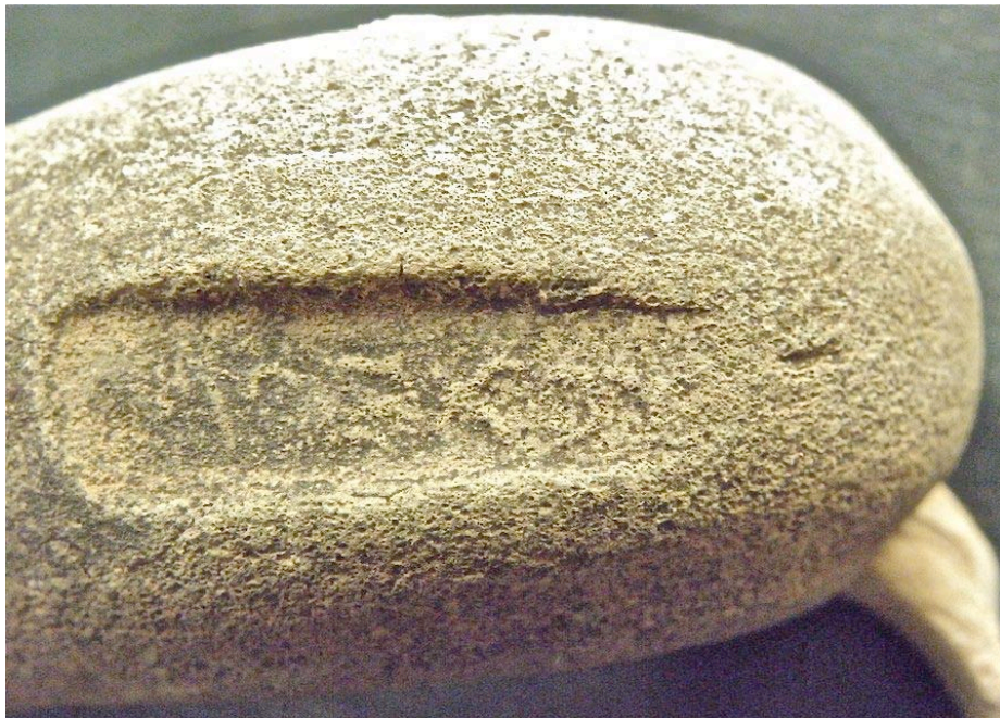
Εικ. 10. Η ενσφράγιστη λαβή υπ' αρ. 8.