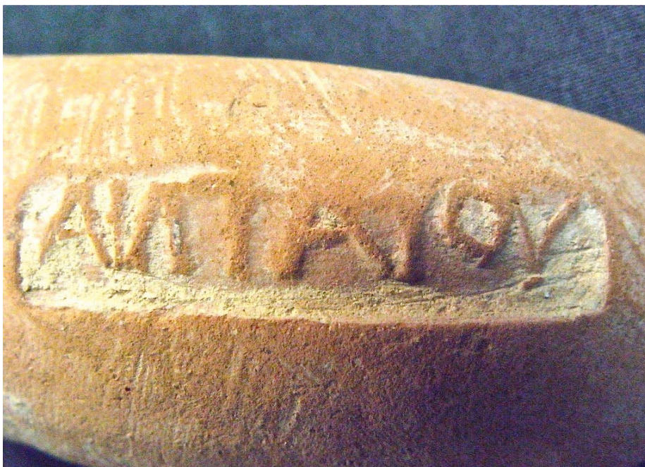
Εικ. 3. Η ενσφράγιστη λαβή υπ' αρ. 3.