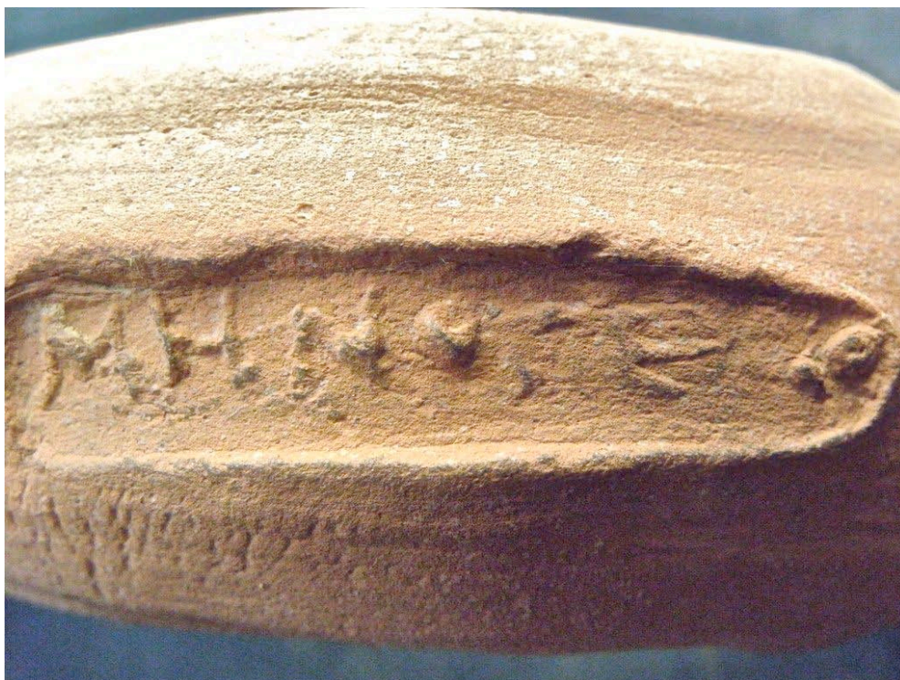
Εικ. 7. Η ενσφράγιστη λαβή υπ' αρ. 5.