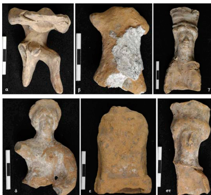
Εικ. 4. Τμήματα ανδρικών κορμών (α, β), κεφαλές γυναικείων ειδωλίων με πόλο (γ, στ), τμήμα Αφροδίτης (δ) και καθιστού σατύρου (ε). Τέλη 6ου - 4ος αι. π.Χ.