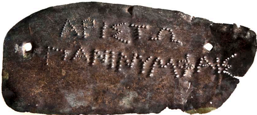
Εικ. 2. Χάλκινο πλακίδιο με ακιδωτή αναθηματική επιγραφή, 4ος αι. π.Χ.