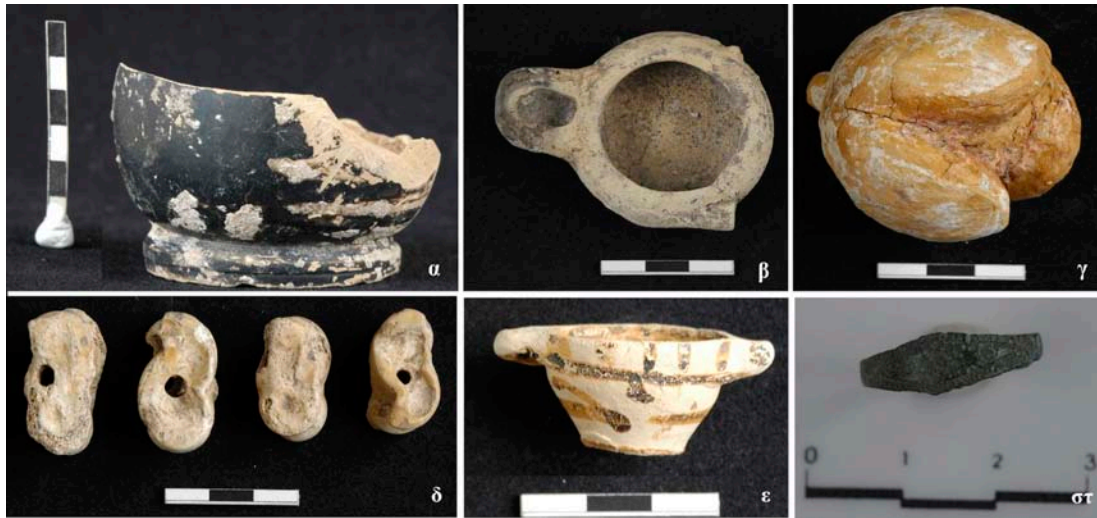
Εικ. 5. Τμήμα αρυβαλλοειδούς ληκυθίου (α), λύχνος (β), ομοίωμα σύκου (γ), διάτρητοι αστράγαλοι (δ), κοτυλίσκη (ε), χάλκινο δαχτυλίδι με διακοσμημένη σφενδόνη (στ). 5ος - 4ος αι. π.Χ.